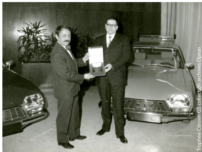
Trophée Citroën GS collection archives Opron