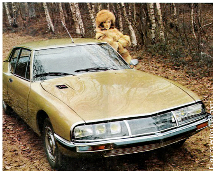
Fulgur collection G. Gillmann

C'est également une association qui propose au grand public de mieux connaître l'architecture et les enjeux qu'elle représente au quotidien grâce à différents événements comme des expositions ou encore des conférences.