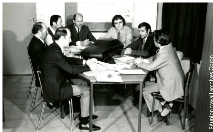
Réunion travail archives Opron